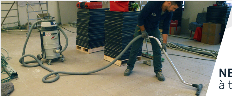
NETTOYAGE DU SOL à traitement terminé