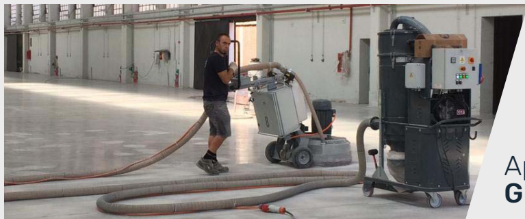
Application avec GRENAILLEUSE