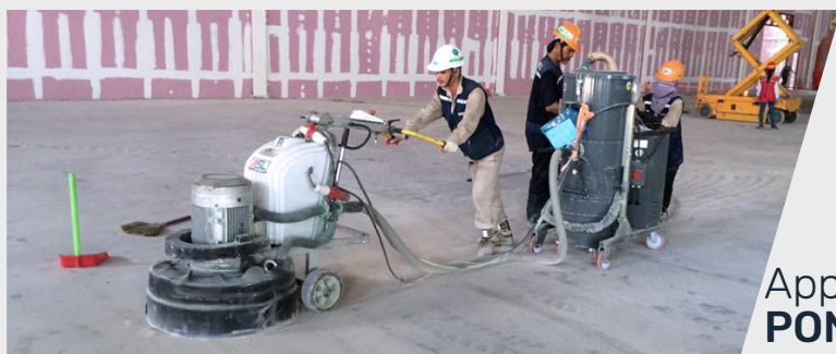
Application avec PONCEUSE pour sol