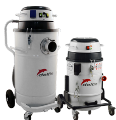
Application avec CAROTTEUSE