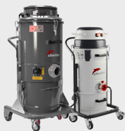
Application avec FRAISEUSE SOL