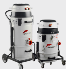
Application avec OUTIL MANUEL