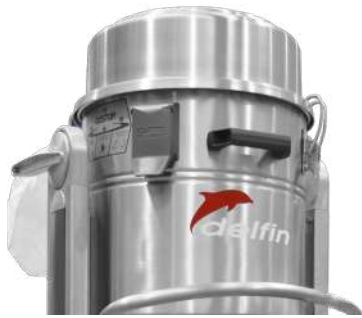
Construcción de acero inoxidable