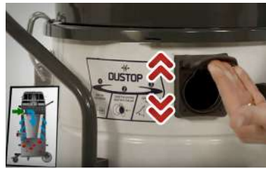
Cómodo sistema de limpieza de filtros semiautomático Dustop