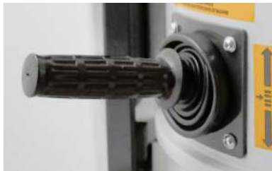
Sistema ergonómico de limpieza manual del filtro