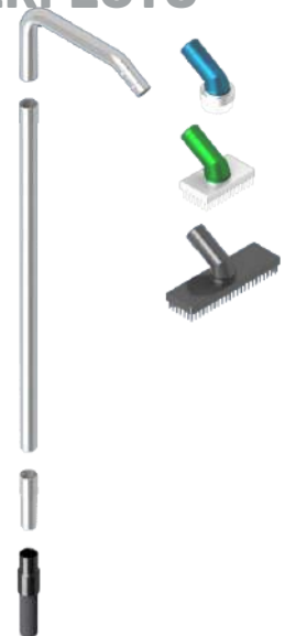
Extensiones para la limpieza de tuberías