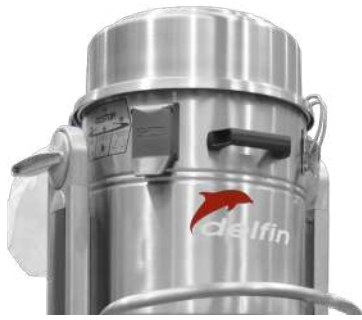
Construction en acier inoxydable