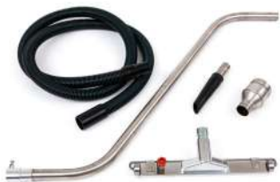
Accessoires antistatiques Acier inoxydable AISI 304

Large gamme d'accessoires ergonomiques pour chaque besoin d'aspiration spécifique dans le monde pharmaceutique / alimentaire