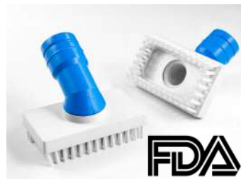
Accessoires colorés Certifié FDA